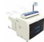
SCANNER KIP 600