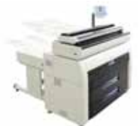
SCANNER KIP 2300