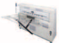
HIGH CAPACITY PRINT TRAY